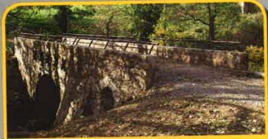
Pont Paradis Pont sur le Fayon alimentant un ancien moulin à foulon puis à farine.